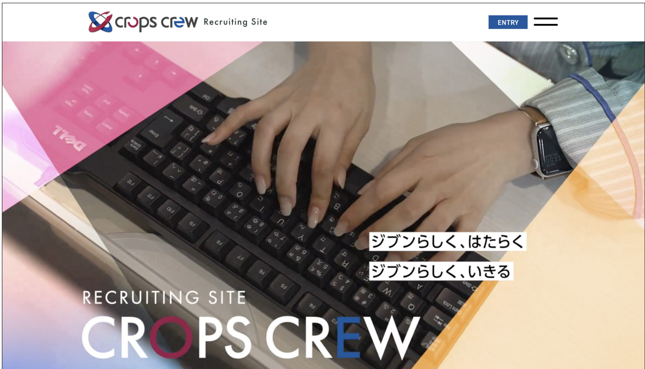
[コンセプトイメージ]